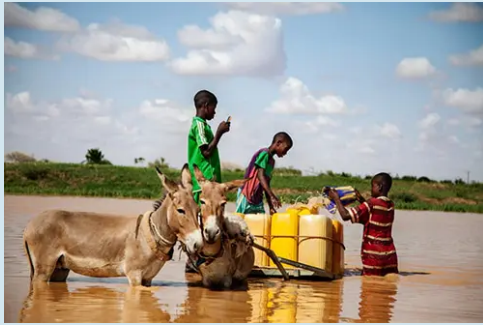
にごった水をくむ子どもたち。ロバで運ぶのだそうです。